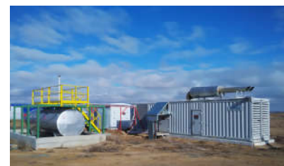
集装箱机组 Generator Enclosure