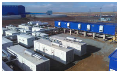
应急电站 Power Station